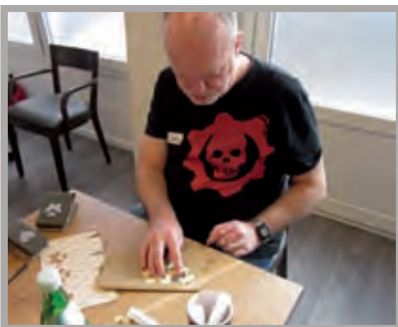
Bild oben: Wir haben die Chance, über uns hinaus zu wachsen. Den alltäglichen Trott zu verlassen, kreativ zu sein und im Neuen etwas Wunderbares zu finden.